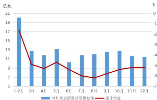
图三 2024 年单月社会消费品零售总额及累计增速情况

回下降态势。从行业分类看，社会消费品零售总额“二增二降”，批发业、餐饮业实现社会消费品零售额同比分别增长 67.5%、1.6%，零售业、住宿业零售额同比分别下降 8.9%、7.3%。