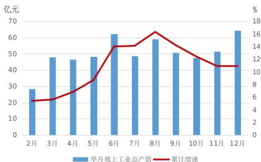
图一 2024 年单月规上工业总产值及累计增速情况

2024 年下半年以来，在海洋装备产业的有力带动下，全区工业产能持续释放，全年实现工业增加值 136.76 亿元，可比增长 7.0%；实现工业总产值 603.33 亿元，同比增长 10.9%，实现规模以上工业总产值 584.58 亿元，同比增长 11.4%。海洋装备业是全区的支柱型产业，全年实现产值 470.36 亿元，同比增长 15.8%，占工业总产值的比重达 78.0%，近三年比重逐年提升（2022 年和 2023 年分别为 72.6%和 75.0%）。受年中更换样本企业影响，工业战略性新兴产业完成产值 158.05 亿元，占规上工业总产值比重为 27.0%，较上年下降 11.3 个百分点。